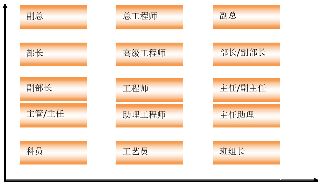
员工职业发展/晋升通道

1、开辟公司员工职业发展新途径，激励其发挥潜能和积极性 依据管理人员和专业技术人员不同的职业发展特点，公司分别建立了三类职业晋升通道。